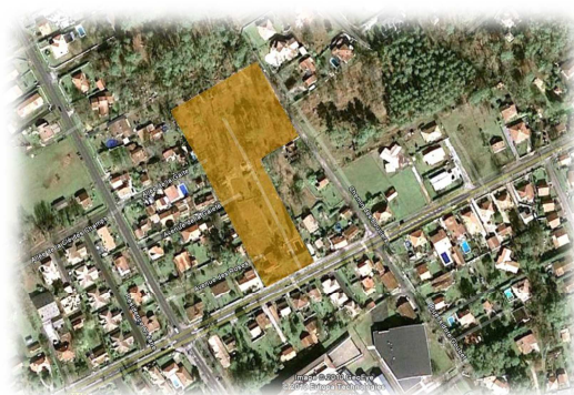
Plan de situation du site

Compte tenu de la superficie du projet, celui-ci est soumis à déclaration au titre des articles 214-1 à L.214-11 du Code de l'environnement et conformément au décret 93-743 du 29 mars 1993 relatif à la nomenclature des opérations concernées par les articles précités et par référence notamment à la rubrique 2.1.5.0 : Rejet d'eaux pluviales dans les eaux douces superficielles, sur le sol ou dans le sous-sol, la surface totale du projet, augmentée de la surface correspondant à la partie du bassin naturel dont les écoulements sont interceptés par le projet, étant supérieure à 1 ha et inférieure à 20 ha.